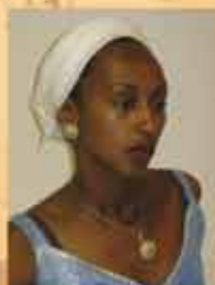
חשיפה לזרבות האתיופיות - עמי 13