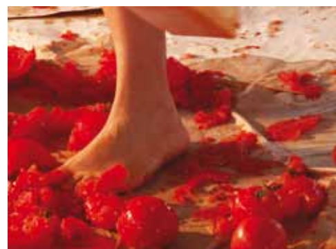
וידאו ארט - רויטל שוב