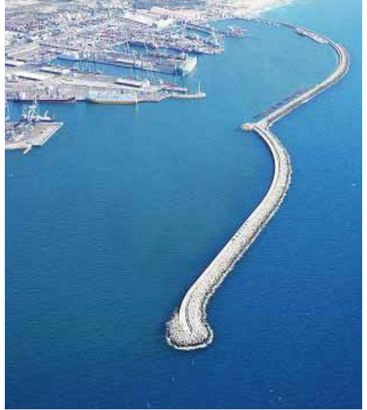
שובר הגלים של אשדוד בתוספת ההארכה החדשה (מדרום למל מצטבר חול)

ערך השמירה על הסביבה טבוע במקורותינו ככתוב בקהלת: "בשעה שברא הקב"ה את האדם הראשון נטלו... ואמר לו, ראה מעשי כמה נאים ומשובחין הן וכל מה שבראתי בשבילך בראתי, תן דעתך שלא תקלקל ותחריב את עולמי שאם קלקלת אין מי שיתקן אחריך".