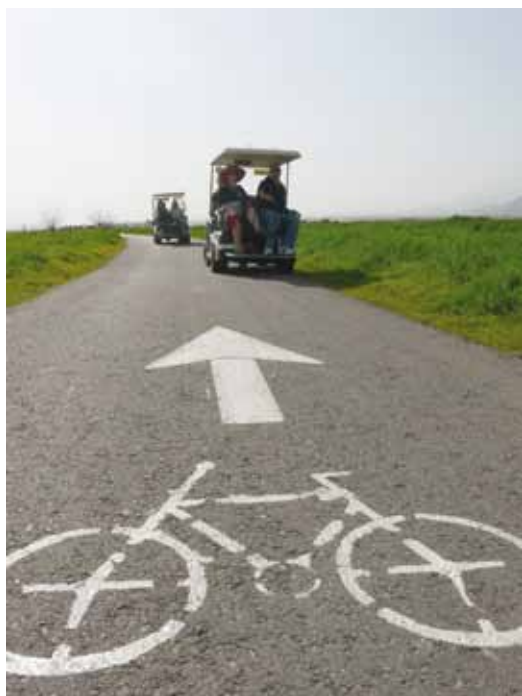
מקום שני - קרין ברין, אחראית תמיכה והדרכה בחמי מערכות מידע

הסטודנטית נטלי פולק, דוברת אגודת הסטודנטים במכללת אורנים ונציגת המועצה הירוקה, ציינה כי “אנו רואים בשמירה על הסביבה את הגרעין לקיומנו. התפקיד שלנו, הסטודנטים, המחנכים לעתיד, לשמש דוגמה לכולם, ולכבד את הסביבה שבה אנו חיים, בלי הסביבה - אין לנו בעצם חיים. המטרה של היום הירוק השנה הייתה להפחית את מספר הרכבים