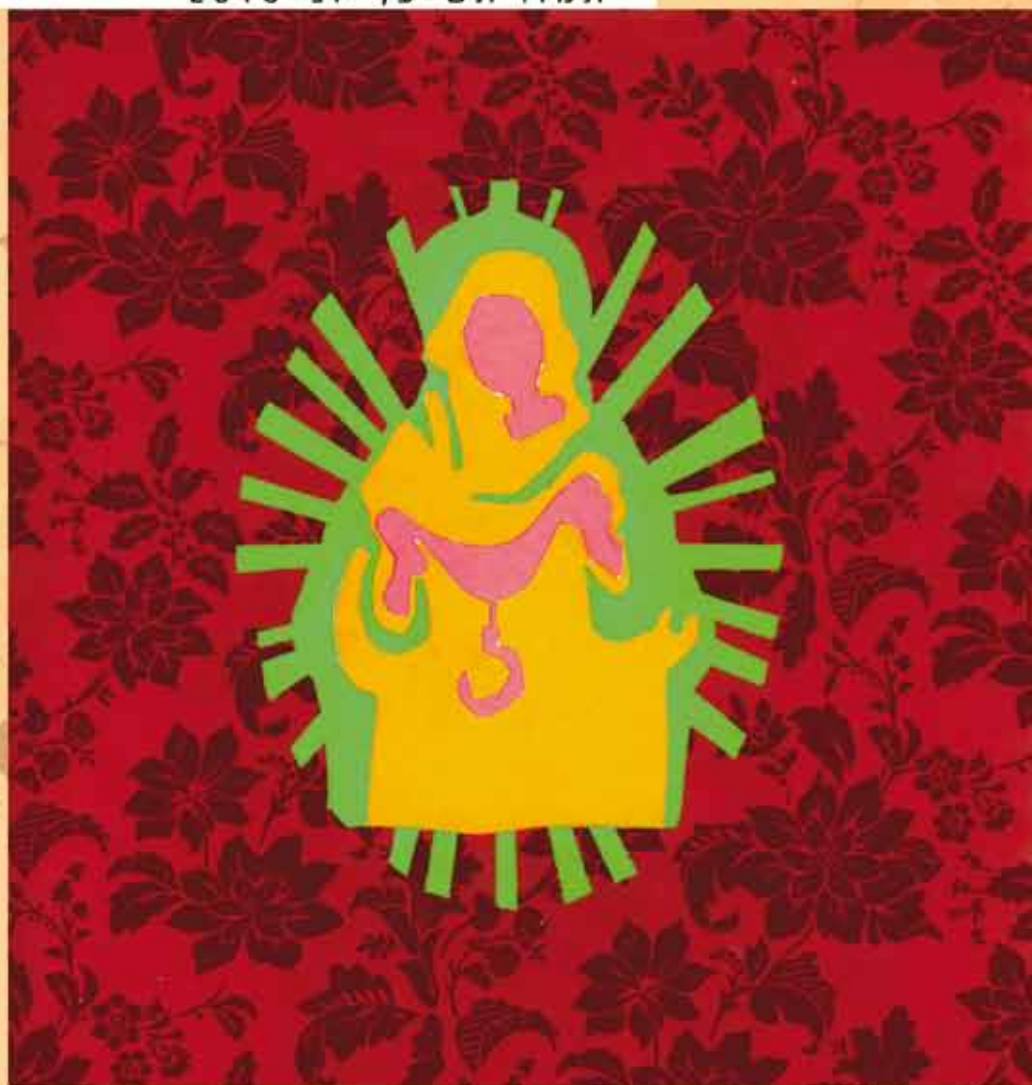
יצירה של הסטודנטית לורה יוסף מתוך תערוכת בוגרים 2010