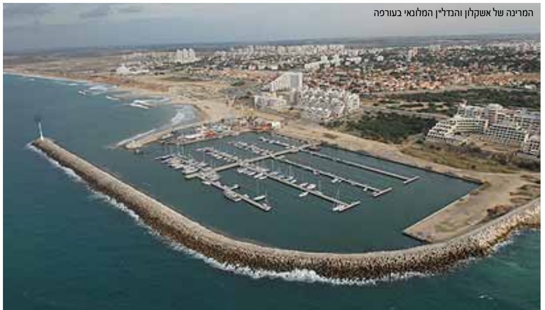
המרינה של אשקלון והנדליין המלוני בעורפה

בסיור הדגשנו ערכים ומשאבים הקשורים לחוף הים בעבר ובהווה: