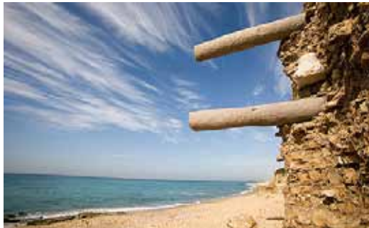
שרידי מצודת אשדוד ים - צילום הודא כנענא, מאי 2010

חוק החופים קובע, כי חופי הים אינם נדל"ן והם אינם עומדים למכירה.