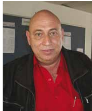
פרופ' שמחה לב-ידון

פרופ' שמחה לב-ידון נשא את הרצאת הפתיחה: 'צבעי אזהרה בצמחים קוצניים'. לדבריו, צבעי אזהרה מוכרים היטב בבע"ח אך תשומת לב מועטה ניתנה לתופעה זו בצמחים. העיקרון העומד בבסיס התאמה אבולוציונית זו הוא יכולת הטורפים ואוכלי הצמחים לקשר בין דגם הצבעוניות לסכנה ולהימנע מלפגוע באורגניזם המוגן. צבעי אזהרה טיפוסיים הם אדום, כתום, צהוב, שחור, לבן וצירופיהם. מוכרים היטב צבעי האזהרה של צרעות (צהוב, שחור, אדום), נחשי אלמוג, נדלים