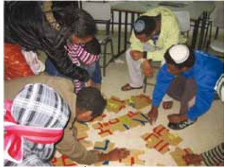
פעילות שדמות בשדה יעקב

התכנית "שמים את הצפון במרכז" ציינה סיום שנה רביעית של פעילות ענפה, מאתגרת, מזוהרת, אינטנסיבית ובעיקר מספקת בכנס שנערך בסוף חודש מאי.