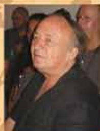
נרבוז באורנים - עמי 20